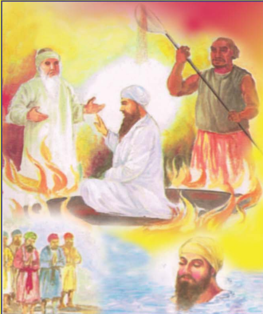
ਧਮਨ ਸਾਹਿਬ ਸ੍ਰੀ ਗੁਰੂ ਅਰਜਨ ਦੇਵ ਜੀ ਮਹਾਰਾਜ ਜੀ ਤੱਤੀ ਲੋਹ ਤੇ ਬੈਠ ਕੇ 'ਤੇਰਾ ਕੀਆ ਮੀਠਾ ਲਾਗੈ' ਦਾ ਸਿਧਾਂਤ ਦਰਸਾਅ ਰਹੇ ਹਨ। ਹੇਠ - ਆਪ ਜੀ ਰਾਵੀ ਦਰਿਆ ਵਿੱਚ ਸਰੀਰ ਨੂੰ ਅਲੋਪ ਕਰਦੇ ਹੋਏ।

ਇਕ ਦਿਨ ਮਾਤਾ ਜੀ ਕੋਠੇ ਤੇ ਖੜ੍ਹੇ ਆਪਣੇ ਕੋਸ਼ ਹਰੇ ਕਰ ਰਹੇ ਸੀ। ਵਾਲ ਝਟਕੇ, ਇਕ ਕਤਰਾ ਨਾਲ ਦੋ ਕੋਠੇ ਤੇ, ਨੀਵਾਂ ਸੀ ਥੋੜ੍ਹਾ, ਉਪਰ ਜਾ ਪਿਆ। ਉਸ ਵੇਲੇ ਤਾਹਨਾ ਦਿਤਾ ਕਿ ਤੇਰੇ ਤਾਂ ਓਲਾਦ ਨਹੀਂ ਹੋਈ, ਤੂੰ ਮੇਰੇ ਉਪਰ ਕੋਸ਼ਾਂ ਦਾ ਕਤਰਾ ਕਿਉਂ ਪਾਇਆ ਹੈ। ਕਪੜੇ ਸੁਕਣੇ ਪਾ ਦਿਤੇ, ਗੋਲੀ