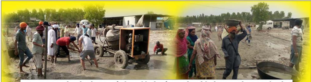
ਟਰਸਟ ਰਤਵਾੜਾ ਸਾਹਿਬ ਦੀ ਨਵੀਂ ਬਰਾਂਚ 'ਸੰਤ ਬੇਲਾ' (ਨੇੜੇ ਸ੍ਰੀ ਅਨੰਦਪੁਰ ਸਾਹਿਬ) ਵਿਖੇ ਦੀਵਾਨ ਹਾਲ ਦੀ ਫਰਸ਼ ਕਾਰਜੇਵਾ ਦ੍ਰਿਸ਼।