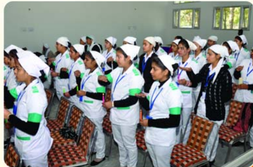
ਰਤਵਾੜਾ ਸਾਹਿਬ ਨਰਸਿੰਗ ਸਕੂਲ ਦੀਆਂ ਬੱਚੀਆਂ ਸਮਾਜ ਸੇਵਾ ਦੀ ਸ਼ੁਰੂਆਤ ਲੈਂਦੀਆਂ ਹੋਈਆਂ।