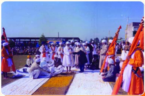
ਗੁਰਦੁਆਰਾ ਈਸ਼ਰ ਪ੍ਰਕਾਸ਼ ਰਤਵਾੜਾ ਸਾਹਿਬ ਦੀ ਨੀਂਹ ਰੱਖਣ ਸਮੇਂ ਮਹਾਂਪੁਰਸ਼।

ਸਵਾਮੀ ਜੀ ਨੇ ਦੇਹਰਾਦੂਨ ਵਿਖੇ ਮੈਡੀਕਲ ਕਾਲਜ ਦੀ ਨੀਂਹ ਪਿਆਰੇ ਮਹਾਂਪੁਰਸ਼ਾਂ ਦੇ ਕਰ-ਕਮਲਾਂ ਤੋਂ ਰਖਵਾ ਕੇ ਇਕ ਵੱਡੀ ਮਿਸਾਲ ਕਾਇਮ