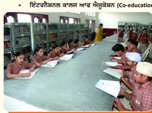
ਰਤਵਾੜਾ ਸਾਹਿਬ ਸਕੂਲ ਦੇ ਬੱਚੇ ਲਾਇਬਰੇਰੀ ਵਿੱਚ ਗਿਆਨ ਹਾਸਲ ਕਰਦੇ ਹੋਏ।

ਮੰਤਵ ਦੇਸ਼-ਵਿਦੇਸ਼ ਦੇ ਹਸਪਤਾਲਾਂ ਦੀਆਂ ਲੋੜਾਂ ਨੂੰ ਪੂਰਿਆਂ ਕਰਨਾ ਤੇ ਬੱਚੀਆਂ ਨੂੰ ਆਪਣੇ ਰੁਜ਼ਗਾਰ ਵਾਸਤੇ ਆਤਮ ਨਿਰਭਰ ਬਣਾਉਣਾ ਹੈ।