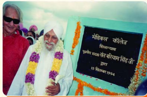
ਜੋਲੀਗਰਾਂਟ (ਦੇਹਰਾਦੂਨ) ਵਿਖੇ ਮੈਡੀਕਲ ਕਾਲਜ ਦਾ ਉਦਘਾਟਨ ਕਰਦੇ ਹੋਏ ਪਿਆਰੇ ਮਹਾਂਪੁਰਸ਼ ਅਤੇ ਨਾਲ ਸ਼ਸ਼ੋਭਿਤ ਡਾ. ਸਵਾਮੀ ਰਾਮ ਜੀ।