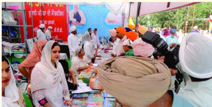
ਆਤਮ ਮਾਰਗ ਸਟਾਲ ਦ੍ਰਿਸ਼।