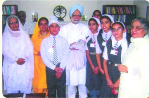
ਰਤਵਾੜਾ ਸਾਹਿਬ ਸਕੂਲ ਦੇ ਬੱਚੇ ਡਾ. ਮਨਮੋਹਨ ਸਿੰਘ ਜੀ ਨਾਲ।

ਦੇਵੇਂ ਸਕੂਲ ਯੋਗ ਤਜਰਬੇਕਾਰ ਪ੍ਰਿੰਸੀਪਲਾਂ ਅਤੇ ਪੜ੍ਹੇ ਲਿਖੇ ਅਧਿਆਪਕਾਂ ਅਤੇ ਯੋਗ ਪ੍ਰਬੰਧਕਾਂ ਦੀ ਨਿਗਰਾਨੀ ਹੇਠ ਤਰੱਕੀ ਦੇ ਰਾਹ ਤੇ ਚਲਦੇ ਹੋਏ ਪੜ੍ਹਾਈ, ਖੇਡਾਂ ਤੇ ਮਿਊਜ਼ਿਕ ਆਦਿ ਦੇ ਖੇਤਰਾਂ ਵਿਚ ਚੰਗਾ ਨਾਮਣਾ ਖੱਟ ਕੇ ਸੰਸਥਾ ਦਾ ਨਾਮ ਬੁਲੰਦ ਕਰ ਰਹੇ ਹਨ।