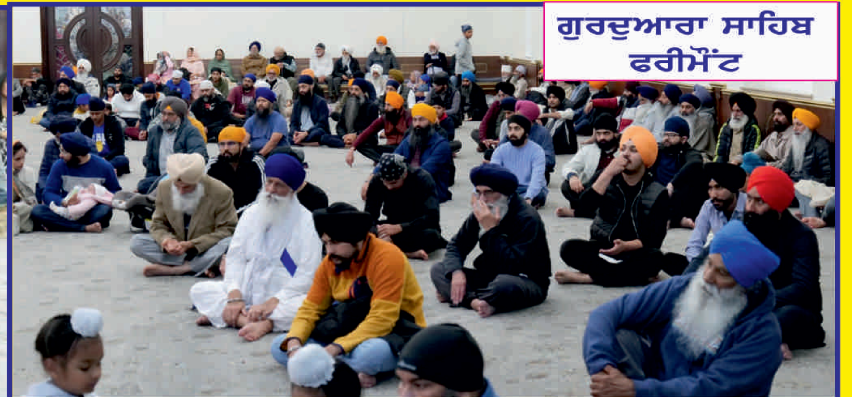
ਗੁਰਦੁਆਰਾ ਸਾਹਿਬ ਫਰੀਮੋਂਟ