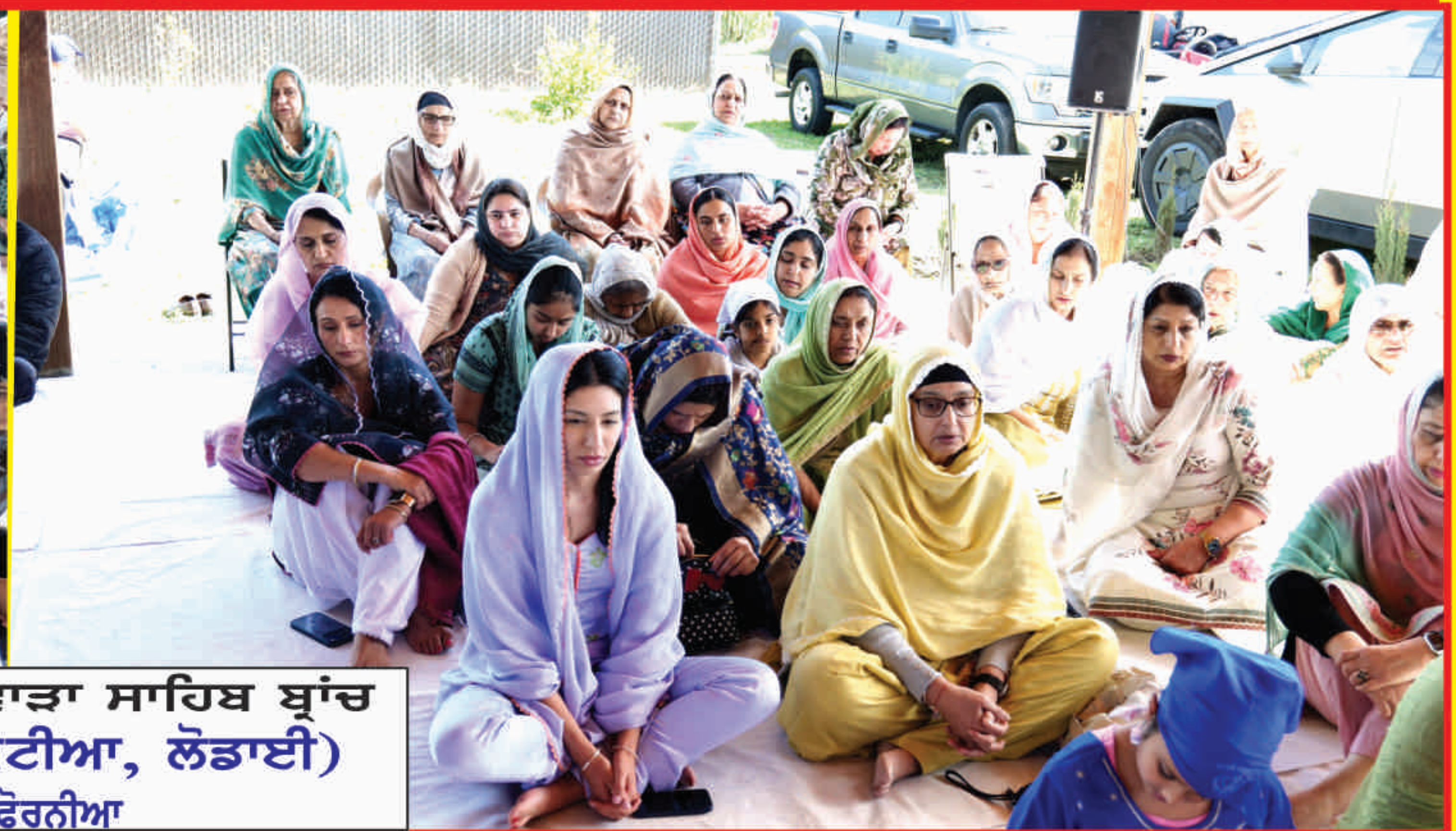
ਟਰਸਟ ਰਤਵਾੜਾ ਸਾਹਿਬ ਬ੍ਰਾਂਚ (ਸਤਨਾਮ ਕੂਟੀਆ, ਲੋਡਾਈ) ਕੈਲੀਫੋਰਨੀਆ