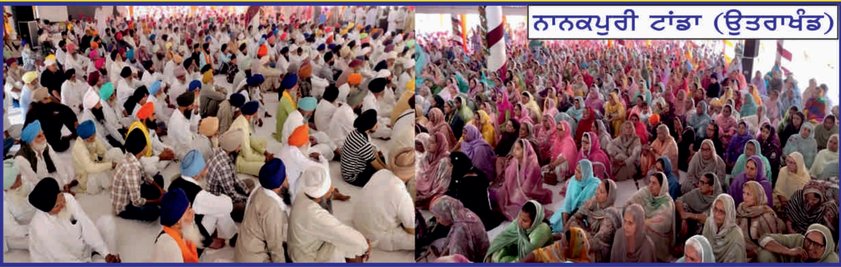
ਨਾਨਕਪੁਰੀ ਟਾਂਡਾ (ਉਤਰਾਖੰਡ)