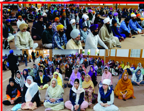
ਗੁਰਦੁਆਰਾ ਮਿਲਵੁਡ ਐਡਮਿੰਟਨ ਵਿਖੇ