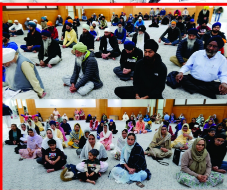
ਗੁਰੂ ਨਾਨਕ ਸਿੱਖ ਗੁਰਦੁਆਰਾ ਸਾਹਿਬ ਸਰੀ ਕੈਨੇਡਾ ਵਿਖੇ