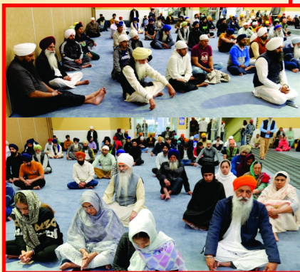
ਗੁਰਦੁਆਰਾ ਦੂਖ ਨਿਵਾਰਨ ਸਰੀ ਕੈਨੇਡਾ ਵਿਖੇ