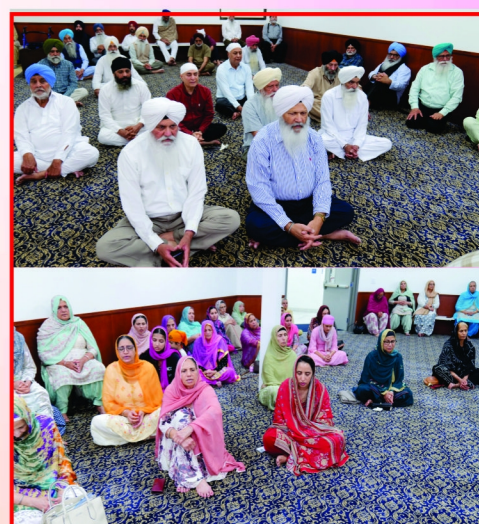
ਗੁਰਦੁਆਰਾ ਮਿਲਵੁਡ ਸੈਨਹੋਜੇ ਅਮਰੀਕਾ ਵੇਅ ਏਰੀਆ ਗੁਰਦੁਆਰਾ ਸਾਹਿਬ ਵਿਖੇ