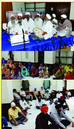
ਗੁਰਦੁਆਰਾ ਨਾਨਕ ਦਰਬਾਰ ਕੈਨੇਡਾ ਅਮਰੀਕਾ ਵਿਖੇ