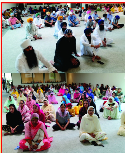
ਮਿਡਵੈਸਟ ਗੁਰਦੁਆਰਾ ਸਾਹਿਬ ਲਨੈਸਾ ਕੈਨੇਡਾ ਅਮਰੀਕਾ ਵਿਖੇ