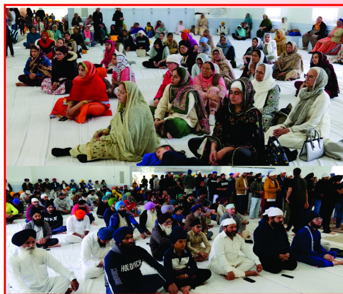
ਗੁਰਦੁਆਰਾ ਦਸਮੇਸ਼ ਕਲਚਰ ਸੈਂਟਰ ਕੈਲਗਰੀ ਵਿਖੇ