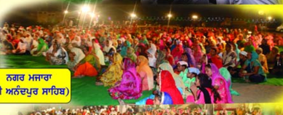
ਨਗਰ ਮਜਾਰਾ (ਸ੍ਰੀ ਅਨੰਦਪੁਰ ਸਾਹਿਬ)