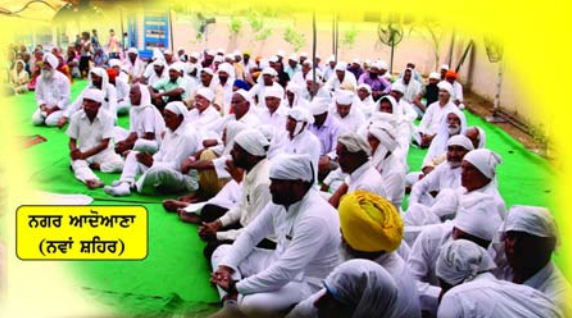
ਨਗਰ ਆਦੋਆਣਾ (ਨਵਾਂ ਸ਼ਹਿਰ)