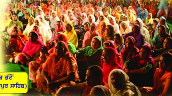
ਨਗਰ ਭੱਟੋਂ (ਸ੍ਰੀ ਅਨੰਦਪੁਰ ਸਾਹਿਬ)